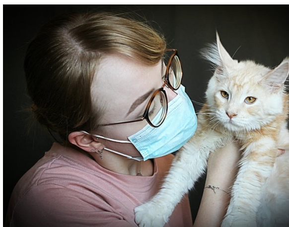
Les deux se plaisent

Pendant la période du confinement, difficile pour tous, il a eu une portée de 12 chatons Maine Coon. Il a dû gérer avec deux chattes pour les tétées et 1 biberon chacun 3 à 4 fois par jour avec l'aide de sa femme et de son fils.